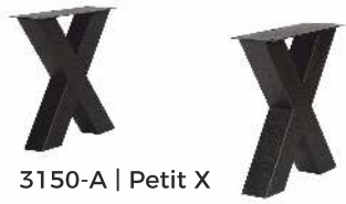
3150-A | Petit X