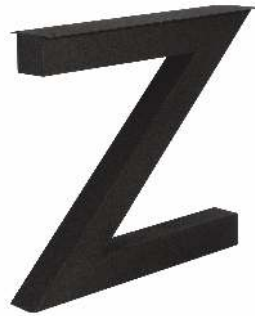
3149 | Z