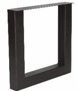
3152 | U