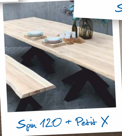
Spin 120 + Petit X