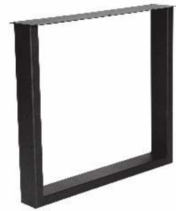
3151 | U Élégant 40x100 mm