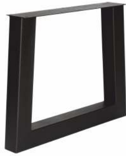
3148 | Trapèze-U

Les pieds sont faites de profilés robustes en tube d'acier. Tous les modèles sont équipés de plaques de montage avec trous pré-perçés pour un montage fiable. Les pieds sont dotés en standard d'une peinture en poudre noire (Ral 9005) pour la protection contre la rouille et la saleté. Autres couleurs sur demande. Soudure serrée contrôlée par ordinateur. Apparence difficile. Sympa à combiner avec notre programme de StarCrown®.