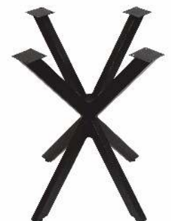
3158 | Lexileg Diamond