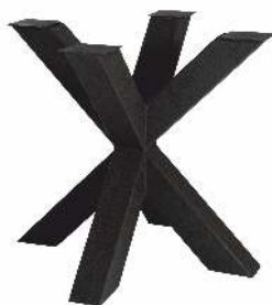
3156 | Spin 80