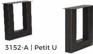
3152-A | Petit U