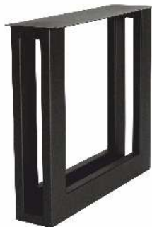
3153 | Double U