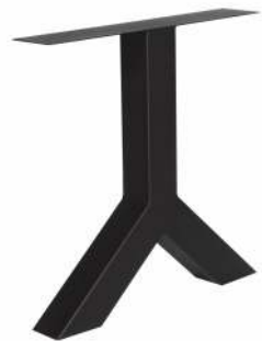
3154 | Y