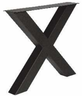
3150 | X 100x100 mm