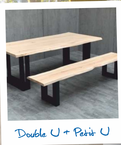
Double U + Petit U