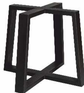
3157 | Mixer Trapèze